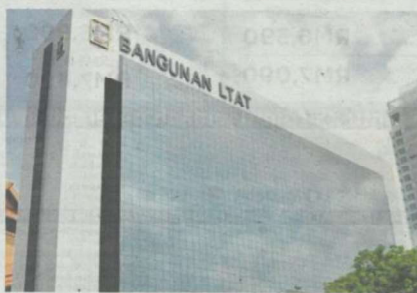
Pihak pengurusan LTAT akan membuat laporan polis sekiranya mengesan elemen jenayah dalam kepincangan kewangan badan berkenaan berkenaan.

LTAT telah mendapati beberapa kepincangan dalam transaksi pada masa lepas oleh pihak lembaga, selain kelemahan dalam bidang operasi, pera-